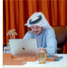
سمو الشيخ خالد بن حمد أثناء اللقاء