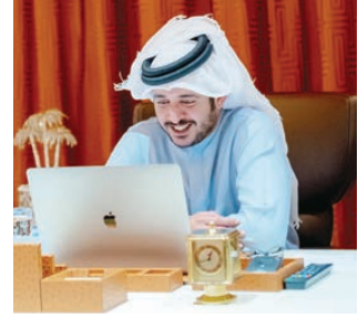
○ سمو الشيخ خالد بن حمد خلال لقائه عددا من الأطفال.