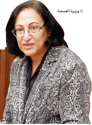
○ وزيرة الصحة.